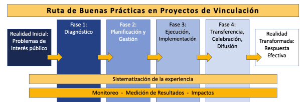
Figura 4. Ruta de Buenas Prácticas en Proyectos de Vinculación

La Figura 4 sintetiza la ruta que siguen las diferentes fases por las cuales transcurren los proyectos de vinculación; su correcta implementación favorece a la consecución de buenas prácticas.