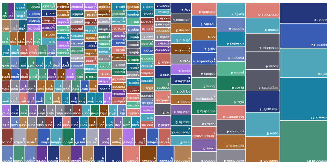
Mapa de árbol

Nota. Dentro de la figura del mapa de árbol de repetición de palabras se encuentran descritas aquellas más comunes en el análisis realizado en ATLAS.ti23.